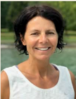
Gerlinde Kaltenbrunner Profi-Bergsteigerin